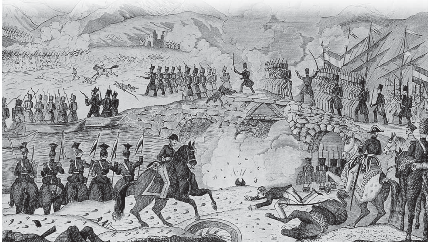
(1) Gizatxar = hombre malo, canalla, bribon.

1.834an Urtarrillaren 27an, Kastañon gudal nagusiak, euskaldunak: “Gizatxarrak”lez (1) zelakotu ebazan.